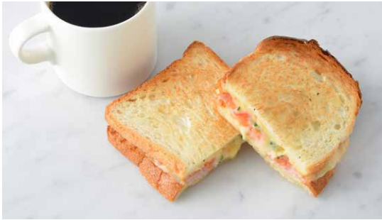
Ham & Melted Cheese Sandwich ハムとチーズのメルトサンド

原材料に小麦・卵・乳成分・大豆・豚肉・鶏肉・りんご・ごまを含む Allergen advice: Wheat, Egg, Milk, Soybean, Pork, Chicken, Apple, Sesame