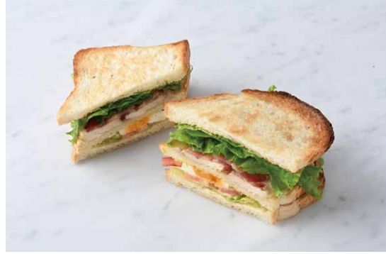
Club House Sandwich クラブハウスサンド

原材料に小麦・卵・大豆・鶏肉・りんご・ごまを含む Allergen advice: Wheat, Egg, Soybean, Chicken, Apple, Sesame