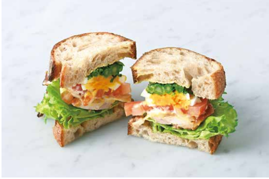
Canola Flower & Teriyaki Chicken Sandwich 菜の花と照り焼きチキンのサンド