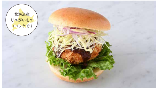
Croquette Burger コロケバーガー

原材料に小麦・卵・乳成分・豚肉を含む Allergen advice: Wheat, Egg, Milk, Pork