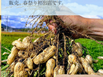
アグリ・アライアンス ピーナッツペースト ¥1,512

「全ての実は健全な土づくりから」を信念にしている農園、アグリ・アライアンスの「ピーナッツペースト」「焙煎落花生」「葱たれ」を販売。春祭り初出店です。