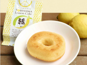
クレセント 呉とびしまレモンケーキ輪 ¥292

広島県呉とびしま海産産の、皮まで食べられるレモンをつかったジューシーなレモンケーキを販売。※レモンケーキの食べ比べもできます。