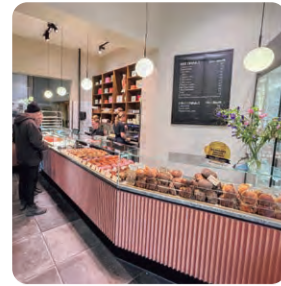
イスランズブリュッゲ店

デンマークには「アンデルセン」が2店舗あります。和のエッセンスを加えた商品があったり、パティシエがつくるカラフルなケーキが並んでいたり、日本のアンデルセンとはかなり雰囲気が違います。デンマークを訪れることがあればアンデルセンだけでなくスタッフおすすめの場所にも寄って、ぜひ本場のヒュッゲを体験してみてください。