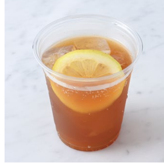
Sweet Spice Soda スイートスパイスソーダ

フレーバーティー(おやゆび姫)、エルダーフラワーシロップ、トニックウォーターをブレンドしました。さわやかで、すっきりとした味わい。