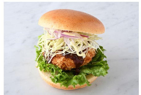
Croquette Burger 安芸津ポテトのコロッケバーガー

原材料に小麦・卵・乳成分・大豆・豚肉を含む Allergen advice: Wheat, Egg, Milk, Soybean, Pork