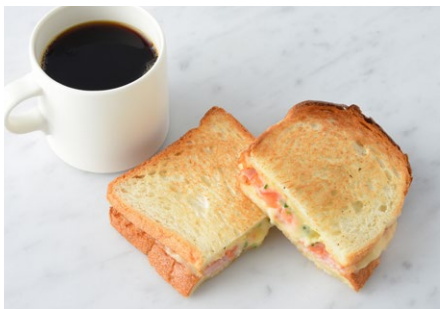
Ham & Melted Cheese Sandwich ハムとチーズのメルトサンド

原材料に小麦・乳成分・豚肉・鶏肉を含む Allergen advice: Wheat, Milk, Pork, Chicken