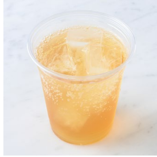
Thumbelina's Tea Tonic おやゆび姫のティートニック