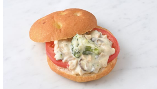
Focaccia Sandwich (Mushroom & Cream) フォカッチャサンド(きのこ&クリーム)

原材料に小麦・卵・乳成分・大豆・豚肉・鶏肉・りんご・ごまを含む Allergen advice: Wheat, Egg, Milk, Soybean, Pork, Chicken, Apple, Sesame