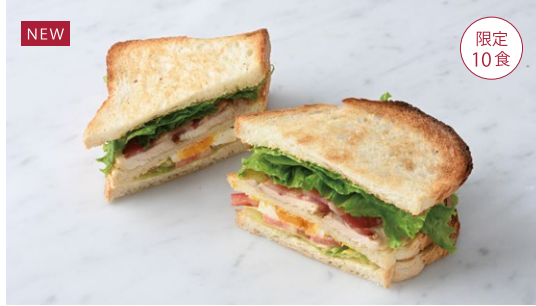
NEW Club House Sandwich クラブハウスサンド