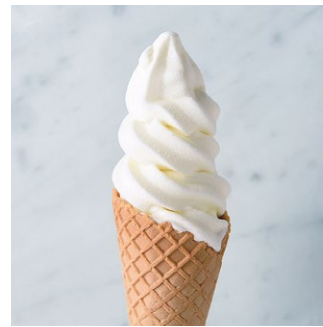
Soft-Serve Ice Cream ミルクソフト

原材料に小麦・卵・乳成分を含む Allergen advice: Wheat, Egg, Milk