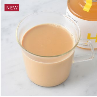
Ginger Milk Tea ジンジャーミルクティー