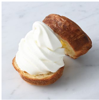
Brioche Soft-Serve Ice Cream Sandwich ブリオッシュの ミルクソフトサンド

原材料に小麦・卵・乳成分・大豆を含む Allergen advice: Wheat, Egg, Milk, Soybean