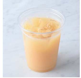
Andersen Farm Apple Juice アンデルセンファームの 林檎ジュース

エスプレッソにカルダモン、クローブ、シナモン、レモンを漬け込んだシロップを炭酸水で割ったソーダです。