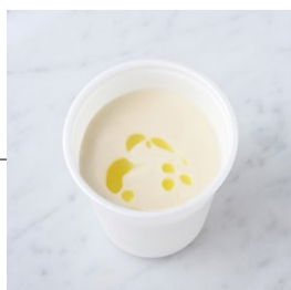
Corn Soup コーンスープ

原材料に卵・乳成分・大豆・鶏肉を含む Allergen advice: Egg, Milk, Soybean, Chicken