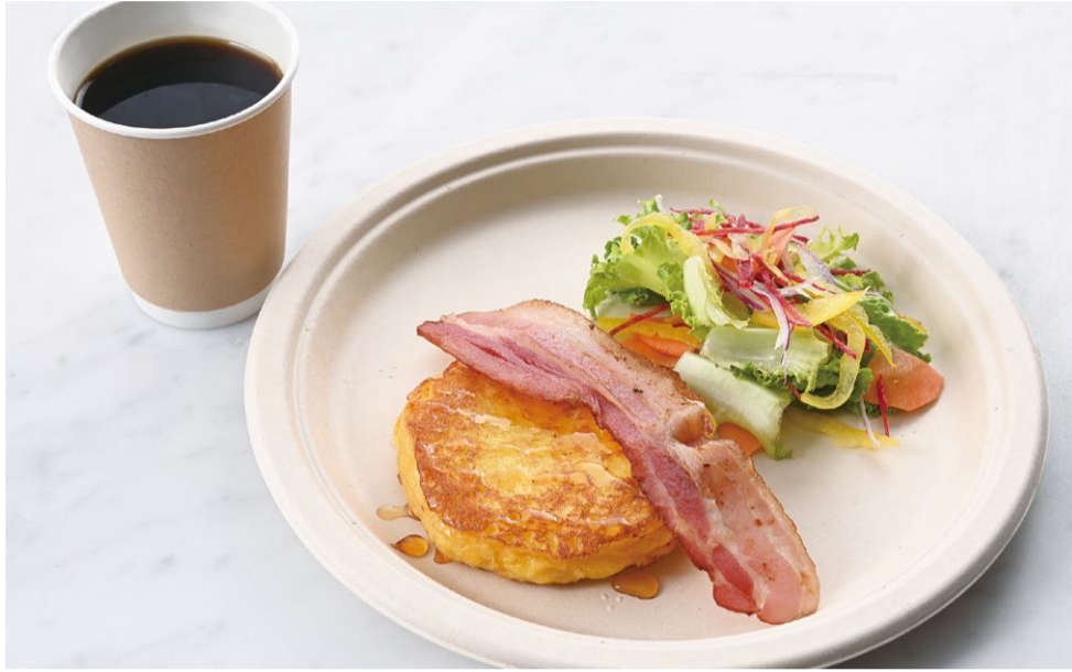
French Toast Set フレンチトーストセット