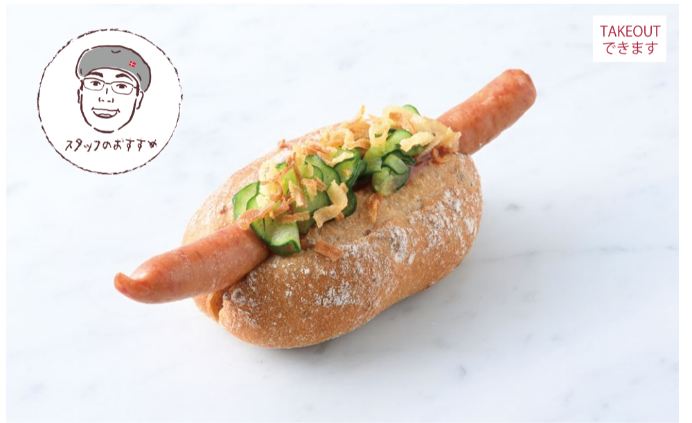
Danish Hot Dog デンマーク風ホットドッグ

●食事前パン(2種)をお選びください。 広島アンデルセンは「パンを大切に」との思いから朝食セットに前日のパン(グリーンタイム商品)を使って、フードロス削減に取り組んでいます。