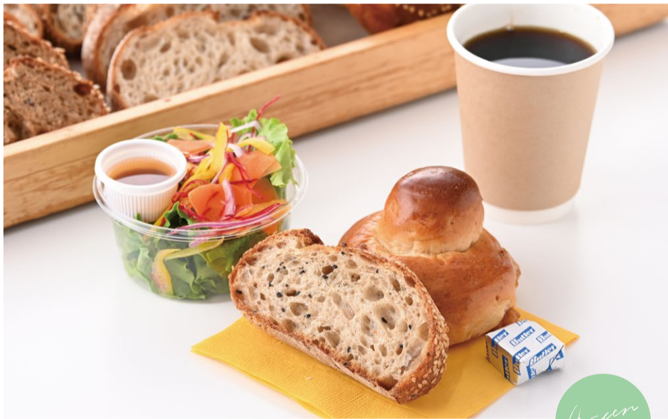
Green Morning Set グリーンモーニングセット

原材料に小麦・卵・乳成分・豚肉を含む Allergen advice: Wheat, Egg, Milk, Pork