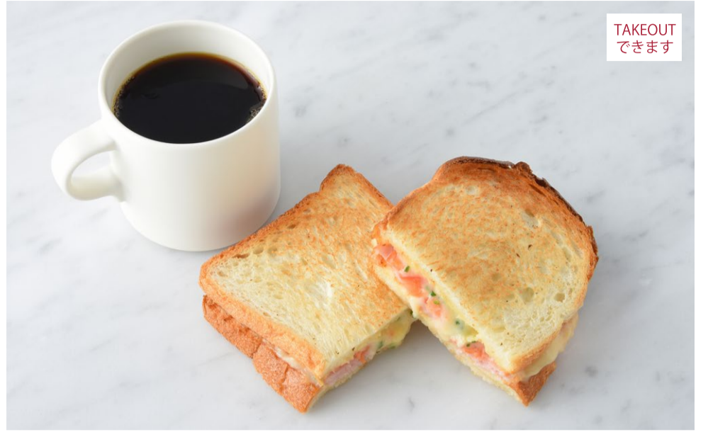
Ham & Melted Cheese Sandwich ハムとチーズのメルトサンド

原材料に小麦・卵・乳成分・大豆・豚肉を含む Allergen advice: Wheat, Egg, Milk, Soybean, Pork