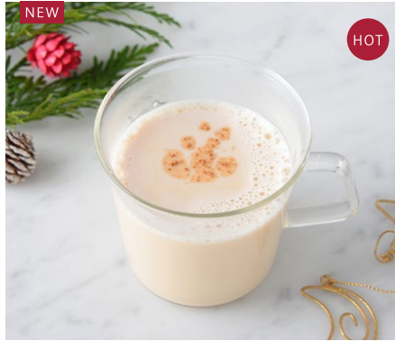
Christmas Milk Tea クリスマスのミルクティー ¥660 税込

爽やかなオレンジフレーバーの紅茶に8種類のスパイスとハーブをブレンドした深みのある味わい。