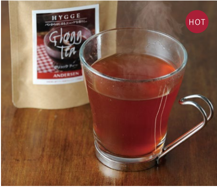
Glogg Tea (Danish Spiced Tea) グリュックティー ¥374 税込

爽やかなオレンジフレーバーの紅茶に8種類のスパイスとハーブをブレンドした深みのある味わい。