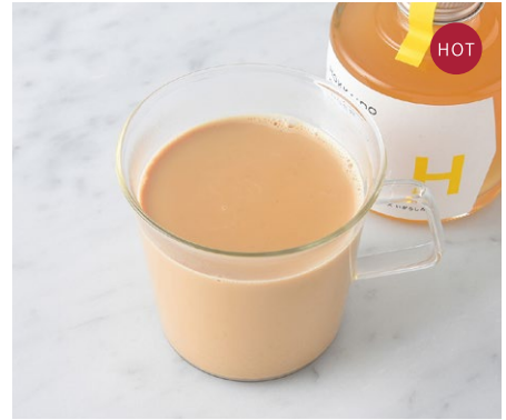
Ginger Milk Tea ジンジャーミルクティー ¥638 税込

3種類のベリーとバイン、オレンジのフレーバーティーにミルクを加えました。仕上げにシナモンパウダーで香り良く。