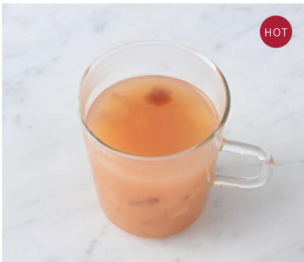
Hot Apple Cider ホットアップルサイダー ¥500 税込

りんごジュースにスターアニス、クローブ、シナモンを入れた温かいドリンク。角切りのりんごとクランベリーがアクセント。