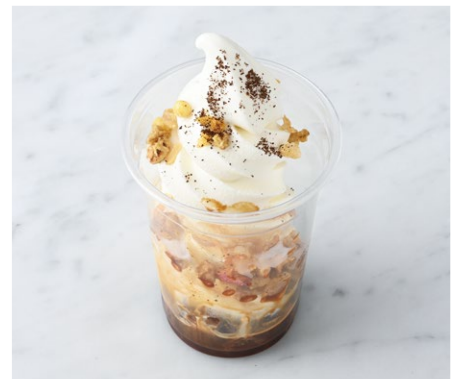
Affogato アフォガード ¥550 税込

チョコスポンジにミルクソフトとエスプレッソ。グラノーラの食感がアクセントになっています。