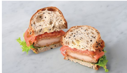
Three Grain Bread Sandwich (Fried Chicken) フライドチキンのトレコンサンド

原材料に小麦・卵・乳成分・豚肉を含む Allergen advice: Wheat, Egg, Milk, Pork