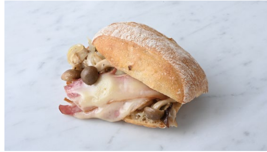
Mushroom & Bacon Hot Sandwich きのこベーコンのホットサンド

原材料に小麦・卵・乳成分・豚肉を含む Allergen advice: Wheat, Egg, Milk, Pork