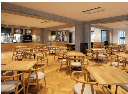
アンデルセンキッチンメインフロア

カジュアルにお過ごしいただけるレストランフロア。 窓からヒュッゲパークが望める個室スペースもございます。 オープンキッチンからお届けするできたてのお料理を 家族や大切な仲間と一緒に楽しみください。