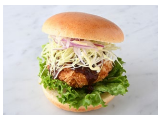
Akitsu Potato Croquette Burger 安芸津ポテのコロケバーガー ¥427 税込 ドリンクセット ¥647 税込

原材料に小麦・卵・乳成分・豚肉を含む Allergen advice: Wheat, Egg, Milk, Pork