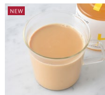
Ginger Milk Tea ジンジャーミルクティー ¥616 税込