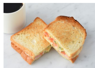
Ham & Melted Cheese Sandwich ハムとチーズのメルトサンド ¥638 税込 ドリンクセット ¥858 税込

原材料に小麦・卵・乳成分・豚肉を含む Allergen advice: Wheat, Egg, Milk, Pork