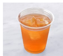
Thumbelina's Tea Tonic (Iced) おやゆび姫のティートニック ¥605 税込

フレーバーティー(おやゆび姫)、エルダーフラワーシロップ、トニックウォーターをブレンドしました。さわやかで、すっきりとした味わい。