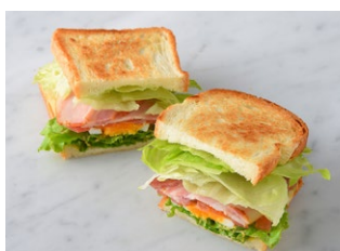
BLET BLET BLET BLET ¥748 税込 ドリンクセット ¥968 税込

原材料に小麦・卵・乳成分・大豆・豚肉・鶏肉・りんご・ごまを含む Allergen advice: Wheat, Egg, Milk, Soybean, Pork, Chicken, Apple, Sesame