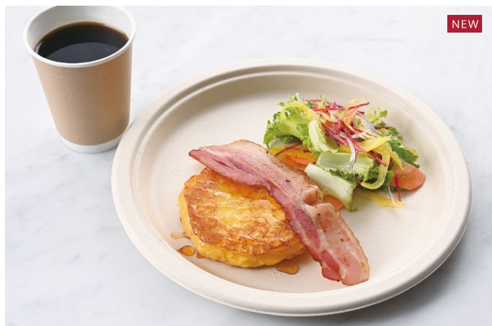
French Toast Set フレンチトーストセット