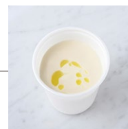
Corn Soup コーンスープ

原材料に卵・乳成分・大豆・鶏肉を含む Allergen advice: Egg, Milk, Soybean, Chicken