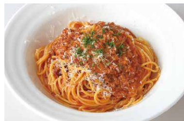
Bolognese Meat Spaghetti ボローニャ風 ミートスパゲッティ ¥1,250

原材料に小麦・乳成分を含む / Allergen advice: Wheat, Milk