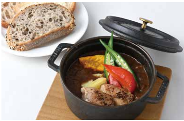
Geihoku Apple Curry (Hiroshima Aging Chicken) 広島熟成どりの芸北りんごカレー (ブレッドバー付※1) ¥1,380

原材料に小麦・卵・乳成分を含む / Allergen advice: Wheat, Egg, Milk