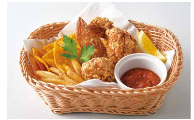
Chicken Basket チキンバスケット ¥1,200

原材料に小麦・乳成分を含む / Allergen advice: Wheat, Milk