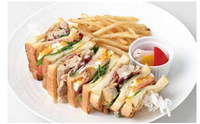
Hiroshima Aging Chicken Club House Sandwich 広島熟成どりの クラブハウスサンド ¥1,450

アレルギー物質特定原材料(8品目)は使用していません。 Not using the 8 specified allergenic ingredients.