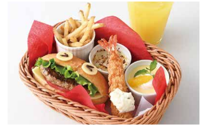
Kids Basket キッズバスケット スマイルハンバーガー、エビフライ、フライドポテト、 チキングラタン、プリン、オレンジジュース ¥950

原材料に小麦・乳成分を含む / Allergen advice: Wheat, Milk