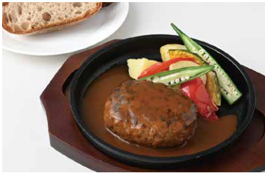
Andersen Stone-Oven Hamburg Steak アンデルセンの石窯ハンバーグステーキ (ブレッドバー付※1) ¥1,650

原材料に小麦・卵を含む / Allergen advice: Wheat, Egg