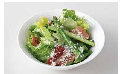
Seasonal Vegetable Caesar Salad 季節野菜の シーザーサラダ(ミニ) ¥600

原材料に小麦・乳成分を含む / Allergen advice: Wheat, Milk