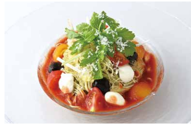
Mozzarella & Tomato Gelée Cold Pasta モッツアレラチーズと トマトジュレの冷製パスタ ¥1,300

原材料に小麦・乳成分を含む / Allergen advice: Wheat, Milk