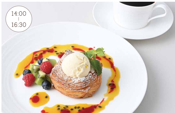
Danish Dessert Tropical