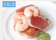
マグロとエビの トマトサラダ