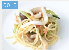
イカとしめじの パスタサラダ