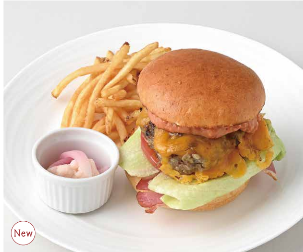
Andersen Stone-Oven Hamburger