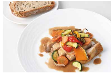
Stone-Oven Grilled Hiroshima Aging Chicken with Balsamic Sauce 広島熟成どりの石窯グリル バルサミソース (ブレッドバー付※1) ¥1,550

原材料に小麦・乳成分を含む / Allergen advice: Wheat, Milk