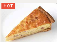
キッシュロレーヌ