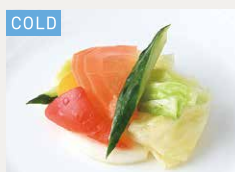
ゆずが香る 彩野菜のマリネ