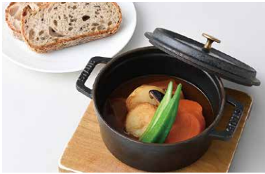
Kogen Black Cow Beef Stew 高原黒牛のビーフシチュー (ブレッドバー付※1) ¥2,250

原材料に小麦・乳成分を含む / Allergen advice: Wheat, Milk