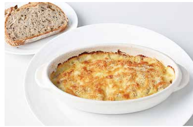
Chicken Macaroni Gratin チキンマカロニグラタン (ブレッドバー付※1) ¥1,600

原材料に小麦・卵・乳成分を含む / Allergen advice: Wheat, Egg, Milk