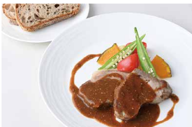
Stone-Oven Grilled Hiroshima Kokubito Pork with Mustard Sauce 広島県産穀美豚の石窯グリル マスタードソース (ブレッドバー付※1) ¥1,850

原材料に小麦・卵・乳成分・えびを含む / Allergen advice: Wheat, Egg, Milk, Shrimp