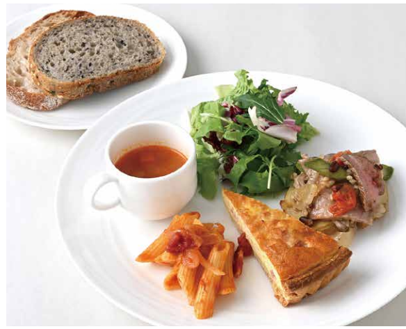
Today's Chef Deli Plate

アレルギー物質特定原材料(8品目)は使用していません。 Not using the 8 specified allergenic ingredients.