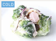
ブロッコリー サラダ