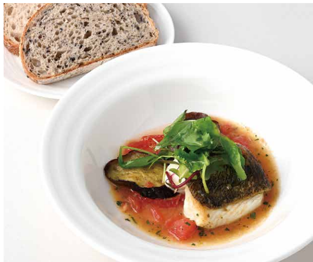
Stone-Oven Grilled Setouchi Sea Bass Aqua Pazza

原材料に小麦・卵・乳成分を含む / Allergen advice: Wheat, Egg, Milk