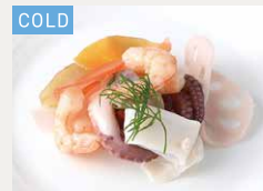
シーフード サラダ