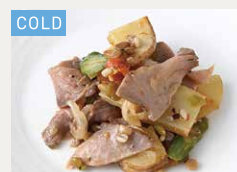
自家製ローストビーフと ポテトのサラダ