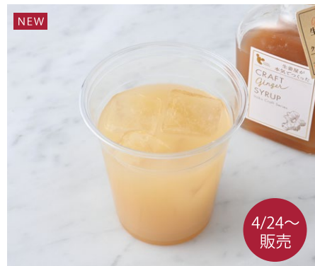
NEW Apple & Ginger アップル&ジンジャー ¥605 税込

アンデルセンファームのりんごジュースにさわやかなジンジャーシロップを入れて仕上げました。