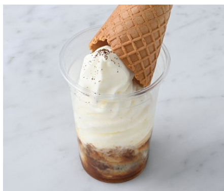
Coffee Jelly & Soft Serve Ice Cream コーヒーゼリーソフト ¥528 税込