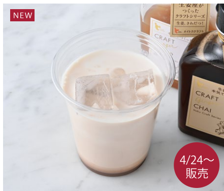
NEW Ginger Iced Chai ジンジャーアイスチャイ ¥605 税込

オレンジリキュールを効かせたホイップで仕上げた香りよいココアです。 ※トッピングのクリームにお酒を使用しています。