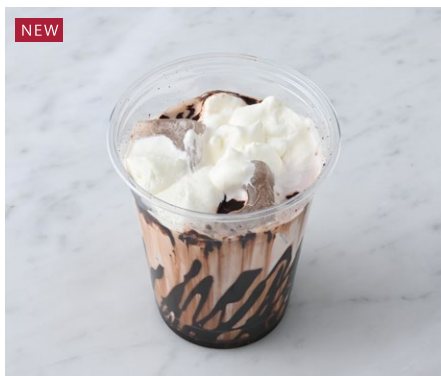
NEW Iced Cocoa アイスココア ¥506 税込

オレンジリキュールを効かせたホイップで仕上げた香りよいココアです。 ※トッピングのクリームにお酒を使用しています。