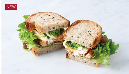
Canola Flower & Teriyaki Chicken Sandwich 菜の花と照り焼きチキンのサンド