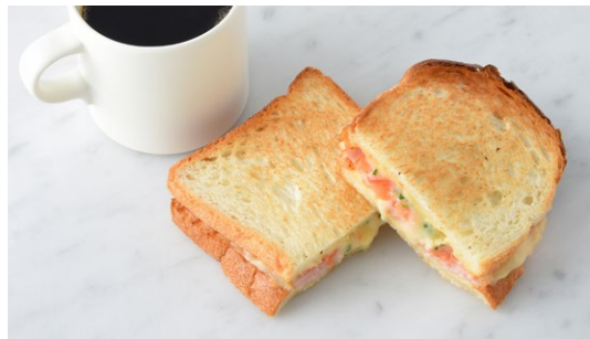
Ham & Melted Cheese Sandwich ハムとチーズのメルトサンド

原材料に小麦・卵・乳成分・大豆・鶏肉・りんご・ごまを含む Allergen advice: Wheat, Egg, Milk, Soybean, Chicken, Apple, Sesame