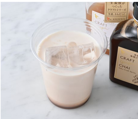
Ginger Iced Chai ジンジャーアイスチャイ ¥605 税込

アンデルセンファームのりんごジュースにさわやかなジンジャーシロップを入れて仕上げました。