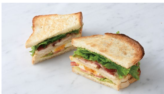
Club House Sandwich クラブハウスサンド

原材料に小麦・卵・乳成分・豚肉を含む Allergen advice: Wheat, Egg, Milk, Pork