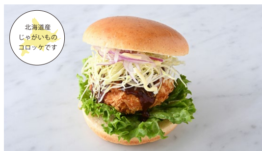
Croquette Burger コロケバーガー

原材料に小麦・卵・乳成分・大豆・豚肉・鶏肉・りんご・ごまを含む Allergen advice: Wheat, Egg, Milk, Soybean, Pork, Chicken, Apple, Sesame