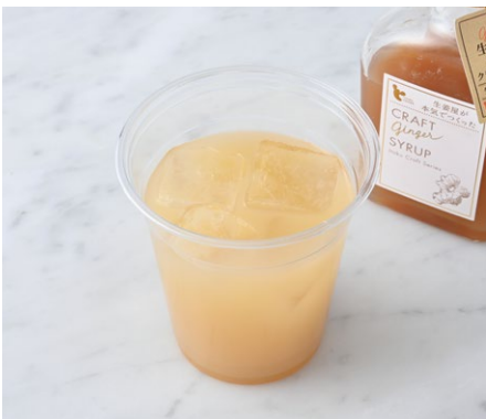
Apple & Ginger アップル&ジンジャー ¥605 税込

オレンジリキュールを効かせたホイップで仕上げた香りよいココアです。 ※トッピングのクリームにお酒を使用しています。