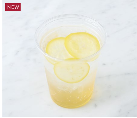
Honey Lemon Soda はちみつレモンソーダ ¥583 税込