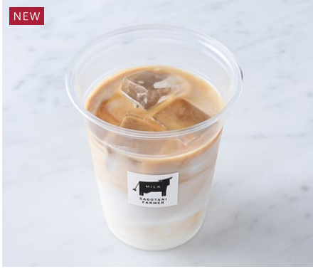
Sagotani Farmer Iced Caffè Latte サゴタニ牧農のアイスカフェラテ ¥506 税込