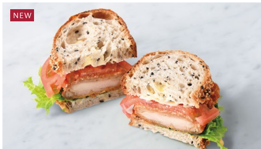
Three Grain Bread Sandwich (Fried Chicken) フライドチキンのトレコンサンド