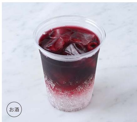
Wine Cocktail (Red Wine Soda) ワインカクテル(赤ワインソーダ) ¥660 税込