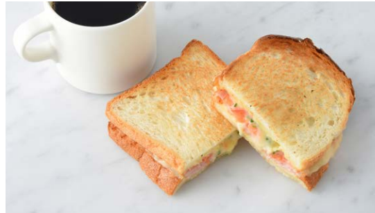
Ham & Melted Cheese Sandwich ハムとチーズのメルトサンド

原材料に小麦・乳成分・豚肉を含む Allergen advice: Wheat, Milk, Pork