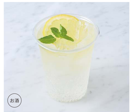
Wine Cocktail (White Wine Soda) ワインカクテル(白ワインソーダ) ¥660 税込