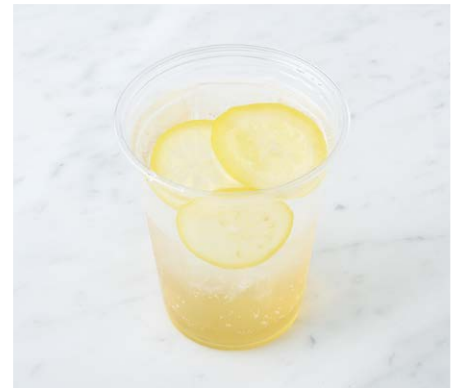
Honey Lemon Soda はちみつレモンソーダ ¥594 税込

エスプレッソにカルダモン、クローブ、シナモン、レモン を漬け込んだシロップを炭酸水で割ったソーダです。