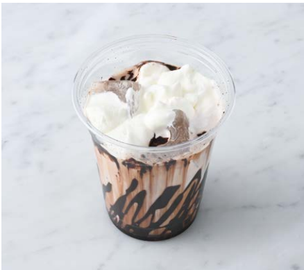
Iced Cocoa アイスココア ¥517 税込

オレンジリキュールを効かせたホイップで仕上げた香りよい ココアです。※トッピングのクリームにお酒を使用しています。