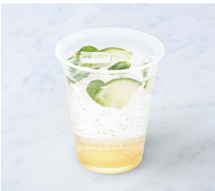
Elder Flower Soda エルダーフラワーソーダ ¥550 税込