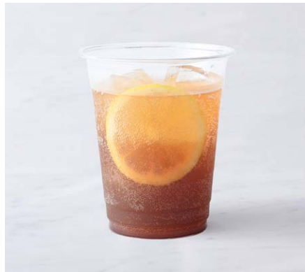
Sweet Spice Soda スイートスパイスソーダ ¥528 税込

オレンジリキュールを効かせたホイップで仕上げた香りよい ココアです。※トッピングのクリームにお酒を使用しています。