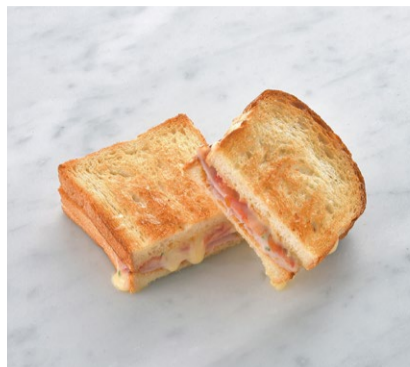
Ham & Melted Cheese Sandwich ハムとチーズのメルトサンド

原材料に小麦・卵・乳を含む Allergen advice: Wheat, Egg, Milk