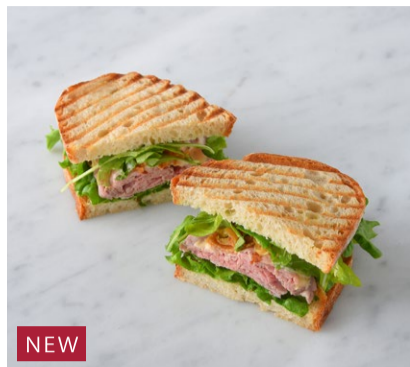
NEW Roast Beef & Arugula Sandwich ローストビーフとルッコラのサンド

※使用する食材が日替わりで変更になるため、すべての7大アレルギーを記載しております。