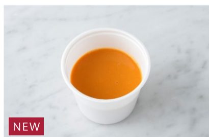
NEW Lobster Bisque オマール海老のビスク ¥550+税

原材料に小麦・乳・海老を含む Allergen advice: Wheat, Milk, Shrimp