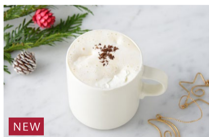
NEW Vienna Coffee アンデルセンの ウイナーコーヒー ¥550+税

3種類のベリーとパイン、オレンジのフレーバーティーに ミルクを加えました。仕上げにシナモンパウダーで香り良く。