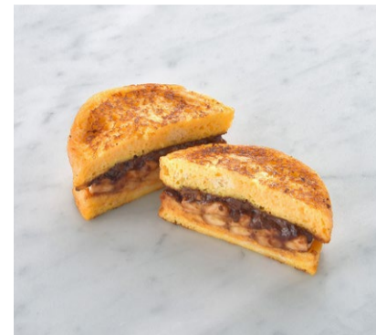
Hazelnut Spret & Banana French Toast Sandwich ヘーゼルナッツココアとバナナの フレンチトーストサンド

原材料に小麦・卵・乳を含む Allergen advice: Wheat, Egg, Milk