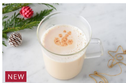
NEW Christmas Milk Tea クリスマスの ミルクティー ¥550+税

3種類のベリーとパイン、オレンジのフレーバーティーに ミルクを加えました。仕上げにシナモンパウダーで香り良く。