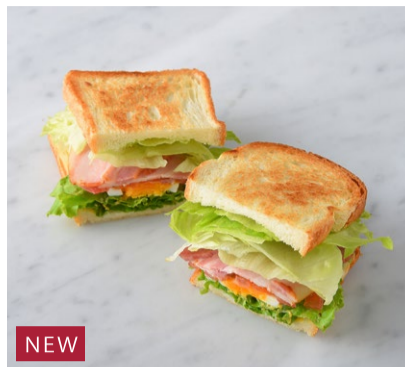
NEW BLET BLET

原材料に小麦・卵・乳を含む Allergen advice: Wheat, Egg, Milk