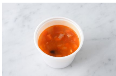
Minestrone ミネストローネ ¥420+税

原材料に小麦・乳・海老を含む Allergen advice: Wheat, Milk, Shrimp