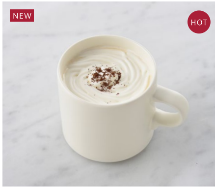
Vienna Coffee アンデルセンのウイナーコーヒー ¥638 税込

爽やかなオレンジフレーバーの紅茶に 8種類のスパイスとハーブをブレンドした深みのある味わい。