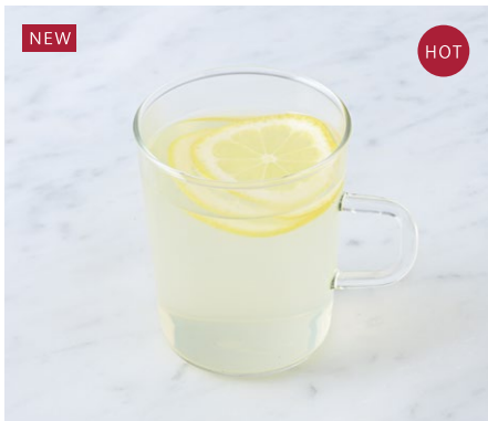
Hot Lemonade ホットレモネード ¥506 税込