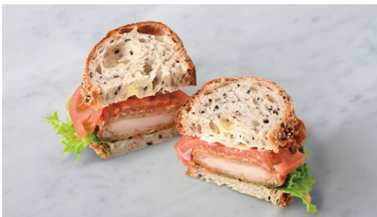
Three Grain Bread Sandwich (Fried Chicken) フライドチキンのトレコンサンド

原材料に小麦・卵・乳成分・豚肉を含む Allergen advice: Wheat, Egg, Milk, Pork