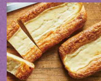
10月21日(金)は アンデルセンの55回目の誕生日!

55周年を記念して全国のアンデルセンのお店でロングデニッシュを特別販売します。パン職人が心を込めて作り、ひとり分ずつに切り分けま。ぜひお楽しみに!