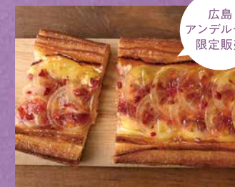
広島アンデルセン 限定販売