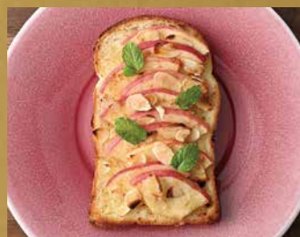
ジンジャーハニーアップルトースト