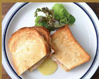
ハムとチーズのメルトサンド