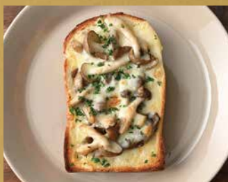
きのこのバタートースト