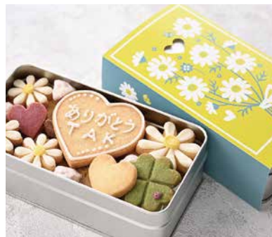
～気持ちを伝えるお手紙クッキー～ 10月新発売「パーソナルクッキー（マーガレット）」 ¥3,888