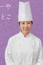
ベーカリー 四之宮

ヨーロッパのパン屋さんのシンボル「クリンゲル」は幸せのかたち。そのクリンゲルをかたどった素朴なデニッシュはサクサクとした食感がたっぷり楽しめます。アーモンドスライスの香ばしさと隠し味のマジパンがポイント。コクのあるコーヒーや濃いめのミルクティーとごいっしょにどうぞ。