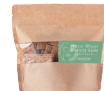
全粒粉ビスキュイサレ ¥734