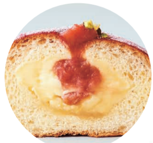
Jordbær & Rabarber

デンマークでの品名は「コペンハーゲン」。首都の名前をつけるほどの自信作なんです。食べたなら、あなたも「コペンハーゲンっ子」に!