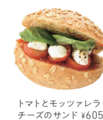
トマトとモッツアレラ チーズのサンド ¥605

毎日のパンを全粒穀物に変えてみませんか? 体も喜ぶし、ライ麦は土壌にもやさしい、そんな時代にあったひとつの選択。旨みと甘みたっぷりのロールパンは、お好みの食材をはさんでサンドイッチにもおすすめ。1F サンドイッチスタンドでも、旬のサンドイッチをご用意しています。 パン・コンブレ ¥972 / サワードゥポロー ¥194 / 全粒粉ポロー ¥194 / ひろしまサワーポロー ¥194