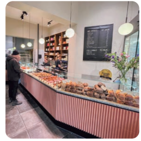
イスランスブリュッゲ店

デンマークには「アンデルセン」が2店舗あります。和のエッセンスを加えた商品があったり、パティシエがつくるカラフルなケーキが並んでいたり、日本のアンデルセンとはかなり雰囲気が違います。デンマークを訪れることがあればアンデルセンだけでなくスタッフおすすめの場所にも寄って、ぜひ本場のヒュッゲを体験してみてください。