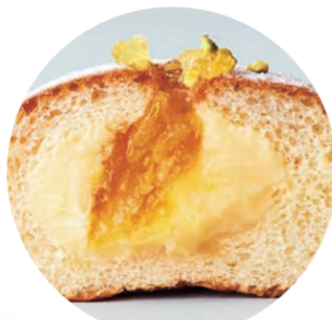
Citron & Mascarpone